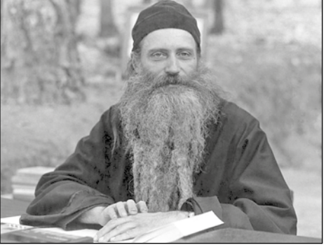
Иеромонах Серафим (Роуз)

такое впечатление, что мне тоже захотелось стремиться к этому. Для этих людей каждый момент их жизни был Богом послан, и это оказало на меня, тогда молодую девушку, очень сильное влияние.