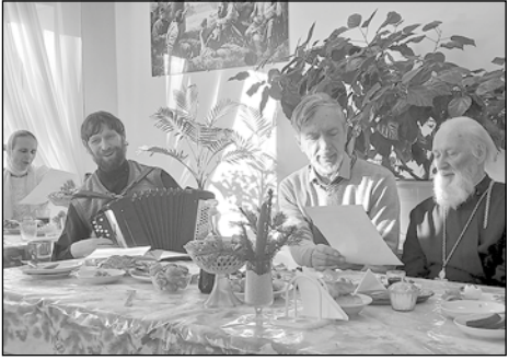
митрополита Тобольского и Тюменского

Настоятель протоиерей Георгий и диакон Евгений Бобков поздравили всех присутствующих прихожан с Рождеством Христовым. Обгласили рождественские послания Патриарха Московского и всея Руси Кирилла и