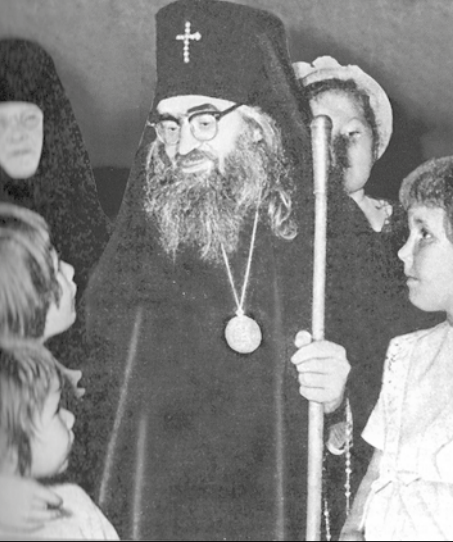
В беседе с детьми

– Владыко, будете ли вы и дальше рядом со мной?