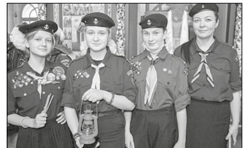
Православные следопыты с Вифлеемским огнем