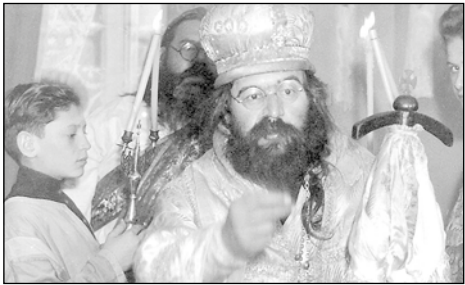
Святитель Иоанн Шанхайский во время богослужения

Все это были духовные люди. Я выросла среди них, и они произвели на меня